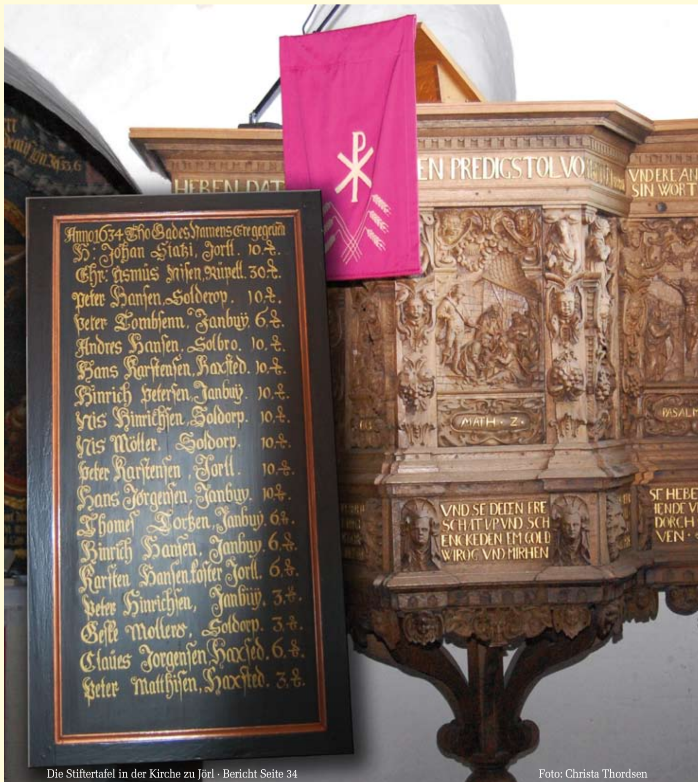
Die Stiftertafel in der Kirche zu Jörl · Bericht Seite 34