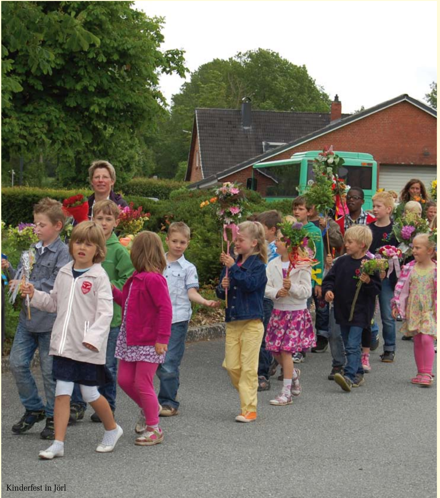
Kinderfest in Jörl