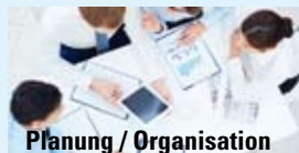
Planung / Organisation

Rufen Sie uns an oder schicken Sie eine E-Mail - wir beraten Sie gerne, auch vor Ort.