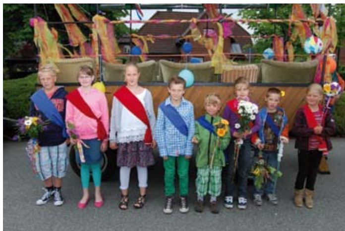
Die neuen Majestäten an der Grundschule