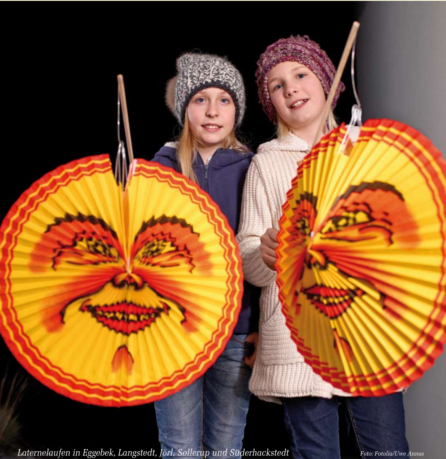
Laternelaufen in Eggebek, Langstedt, Jörl, Sollerup und Süderhackstedt