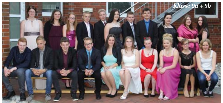
Klasse 9a + 9b