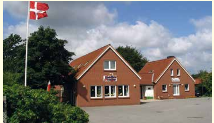
Außenansicht der Schule und Kindergarten

An der gleichen Adresse befindet sich der Kindergarten, die Sporthalle, der Sportplatz und ein großer Spielplatz.