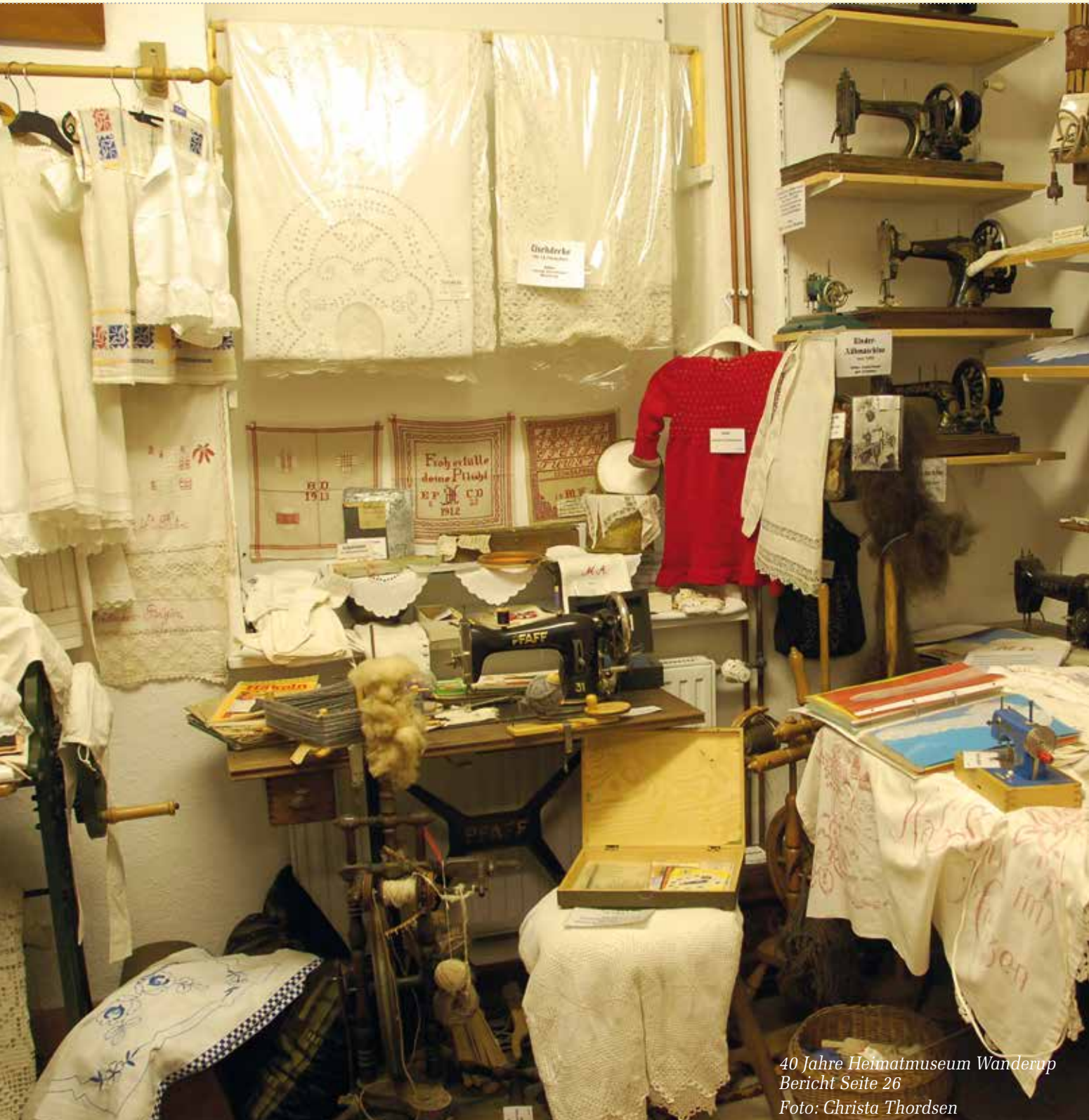
40 Jahre Heimatmuseum Wanderup Bericht Seite 26