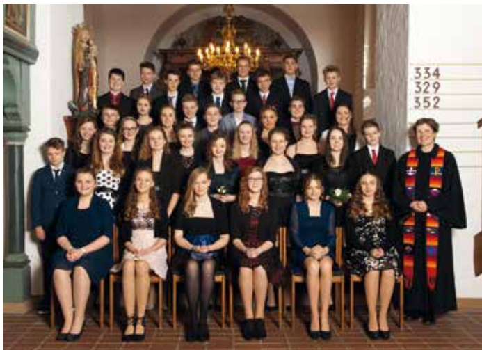
Konfirmanden eingeseget in Eggebek