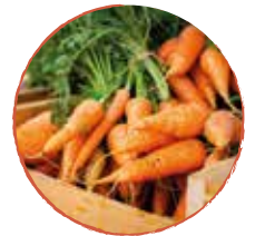
2 Wurzeln geschält & in Würfel geschnitten

Dazu benötigen Sie: Brühe, Wasser, Salz, Pfeffer, krause Petersilie, ein wenig Schlagsahne, Schinkenspeckwürfel & Zwiebelwürfel