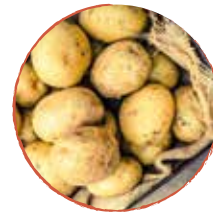
ca. 750 g Kartoffeln geschält & in Würfel geschnitten