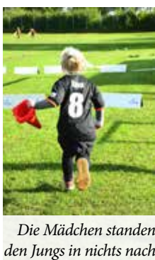
Die Mädchen standen den Jungs in nichts nach