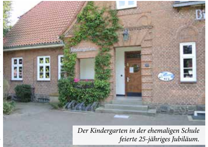
Der Kindergarten in der ehemaligen Schule feierte 25-jähriges Jubiläum.

Abschließend gab der Bürgermeister bekannt, dass die traditionellen Dorfveranstaltungen Laternelaufen, Gänseverspielen und der Kameradschaftsabend der Feuerwehr coronabedingt in diesem Jahr leider ausfallen müssen.