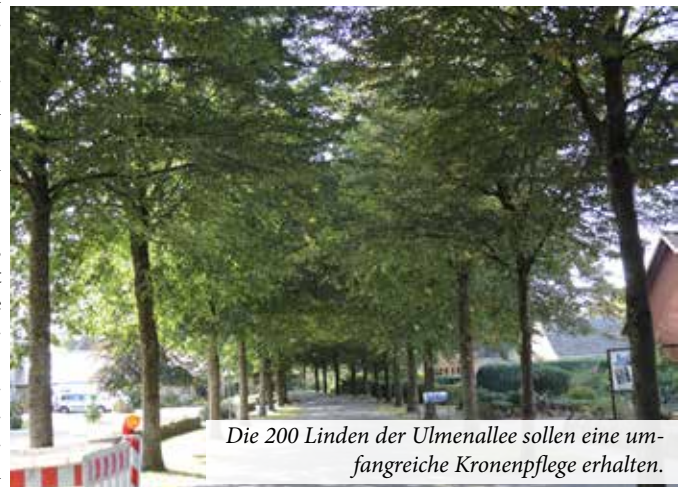
Die 200 Linden der Ulmenallee sollen eine umfangreiche Kronenpflege erhalten.