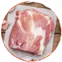
1 kg Kasseler Nacken ausgelöst