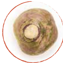
1 Steckrübe geschält & in Würfel geschnitten