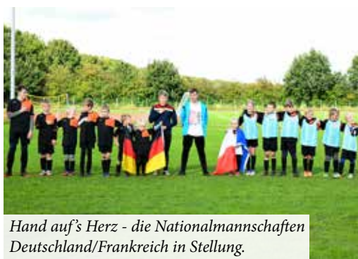
Hand auf's Herz - die Nationalmannschaften Deutschland/Frankreich in Stellung.