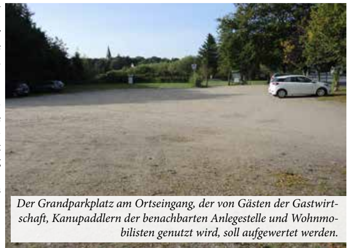
Der Grandparkplatz am Ortseingang, der von Gästen der Gastwirtschaft, Kanupaddlern der benachbarten Anlegestelle und Wohnmobilisten genutzt wird, soll aufgewertet werden.