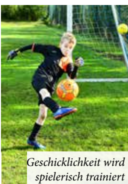
Geschicklichkeit wird spielerisch trainiert