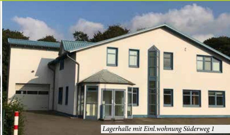
Lagerhalle mit Einl.wohnung Süderweg 1