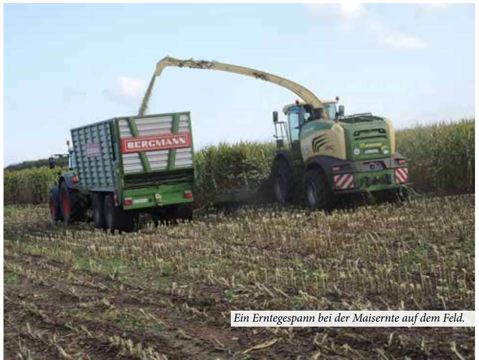
Ein Erntegespann bei der Maisernte auf dem Feld.

Im Kreisgebiet werden auf insgesamt ca. 40.000 ha Mais angebaut, wovon die eine Hälfte des Ertrages für Biogasanlagen verwandt wird und die andere Hälfte als Viehfutter für die Milchviehwirtschaft im Winter dient. In der Biogas-