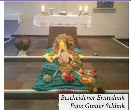
Bescheidener Erntedank