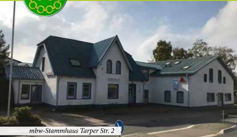
mbw-Stammhaus Tarper Str. 2