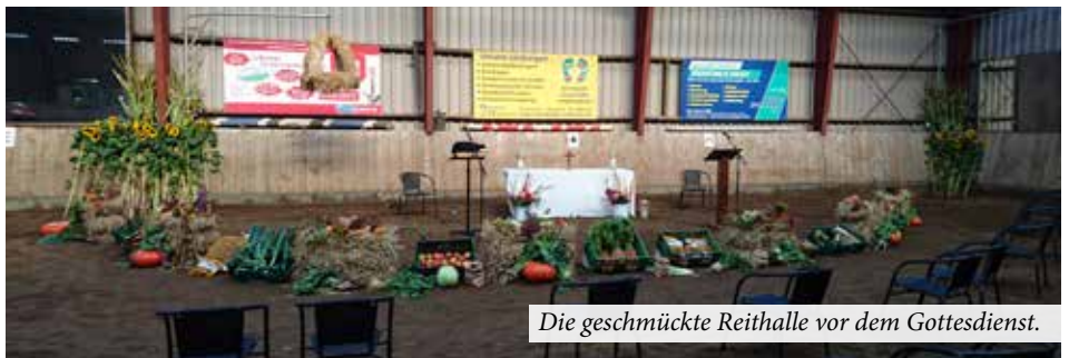
Die geschmückte Reithalle vor dem Gottesdienst.