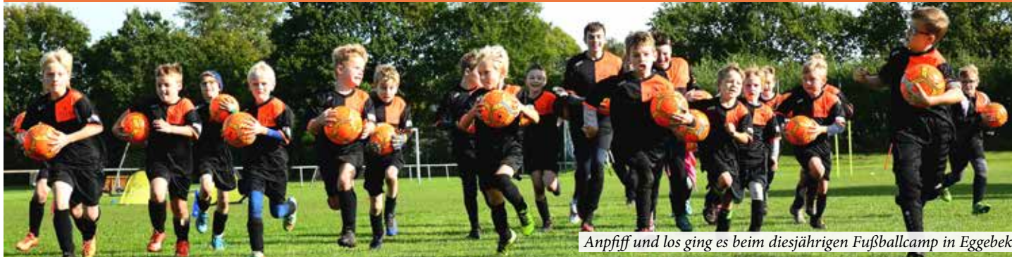
Anpiff und los ging es beim diesjährigen Fußballcamp in Eggebek