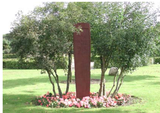
Das Ehrenmal in Langstedt

Der Bebauungsplan sieht eine Aufteilung der überplanten Fläche in 36 Grundstücke vor. Im ersten Bauabschnitt stehen 20 Grundstücke zum Verkauf zur Verfügung. Der Preis pro Quadratmeter beträgt voll erschlossen 50,36 €