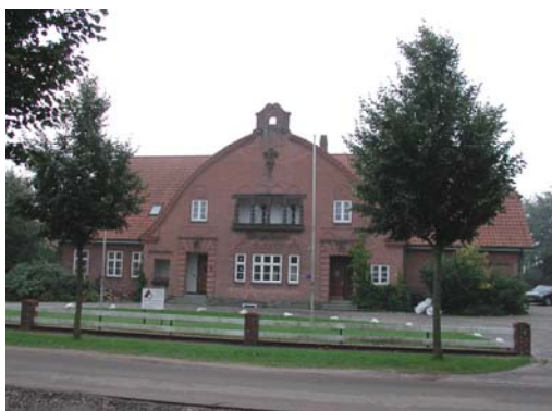
Das Bürgerhaus in Langstedt mit Kindergarten

Innerhalb des Baugebietes wird ein öffentlicher Spielplatz von der Gemeinde neu erstellt. Ein Kindergarten befindet sich in der Gemeinde. Es ist gewährleistet, dass jedes Kind einen Krippen-/Kindergartenplatz erhält. Eine Grund- und Regionalschule befindet sich in der Gemeinde Eggebek. In der Gemeinde Tarp ist eine Gemeinschaftsschule vorhanden. Die anderen weiterführenden Schulen für den gymnasialen Zweig sowie weitere Fachschulen befinden sich in Flensburg und Schleswig.