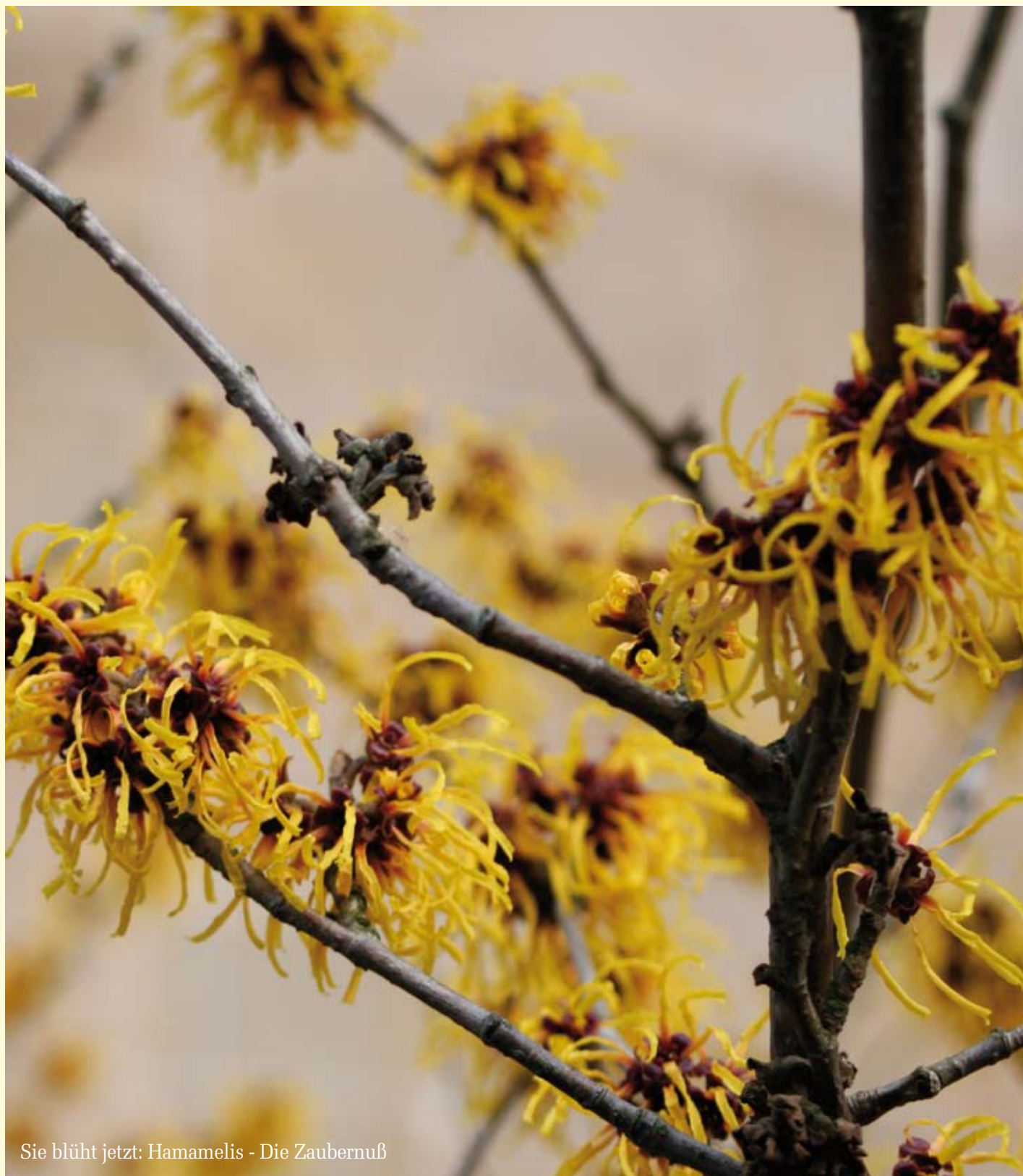
Sie blüht jetzt: Hamamelis - Die Zaubernuß