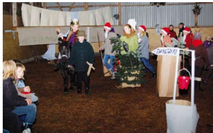
Der Prinz führt die Schneewittchen in sein Schloss

und dem Besuch des Weihnachtsmanns fand der Weihnachtsnachmittag dann einen fröhlichen Ausklang. Für alle Beteiligten steht fest, so eine Weihnachtsfeier gibt es auch im nächsten Jahr wieder!