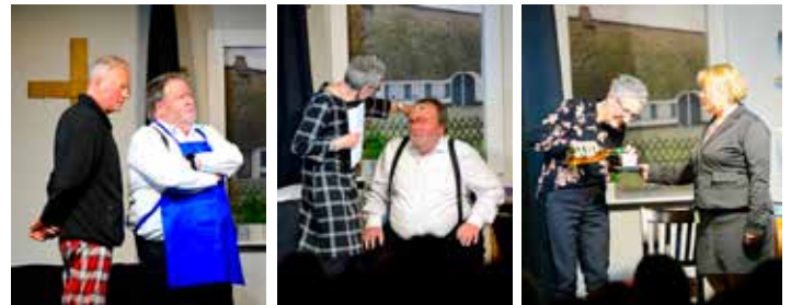
BU: Betrügen geht gar nicht..... oder vielleicht doch?

Schwarzer Humor ist, wenn für gewöhnlich ein Beitrag in ernster Form aber in satirischer Weise behandelt wird. Er kann süffisant, makaber oder zynisch sein und zielt darauf ab, eine emotionale Reaktion hervorzurufen, die über einfaches Lachen hinausgeht. Schwarze Komödien behandeln meist ernste Themen wie Tod, Verbrechen oder gesellschaftliche Probleme. Diese werden aber mit Humor verbunden, um so einen realitätsfernen und zum Nachdenken anregenden Kontrast zu schaffen. Schon im antiken Griechenland war das Zusammenspiel von tragischen und komischen Elementen üblich.