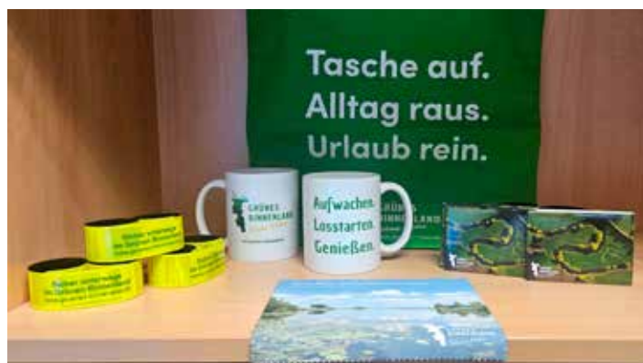
BU: Regionale Produkte, Erinnerungsstücke sowie Infomaterial findet man in der Touristinformation.

Touristinformation Tarp Dorfstraße 8, 24963 Tarp