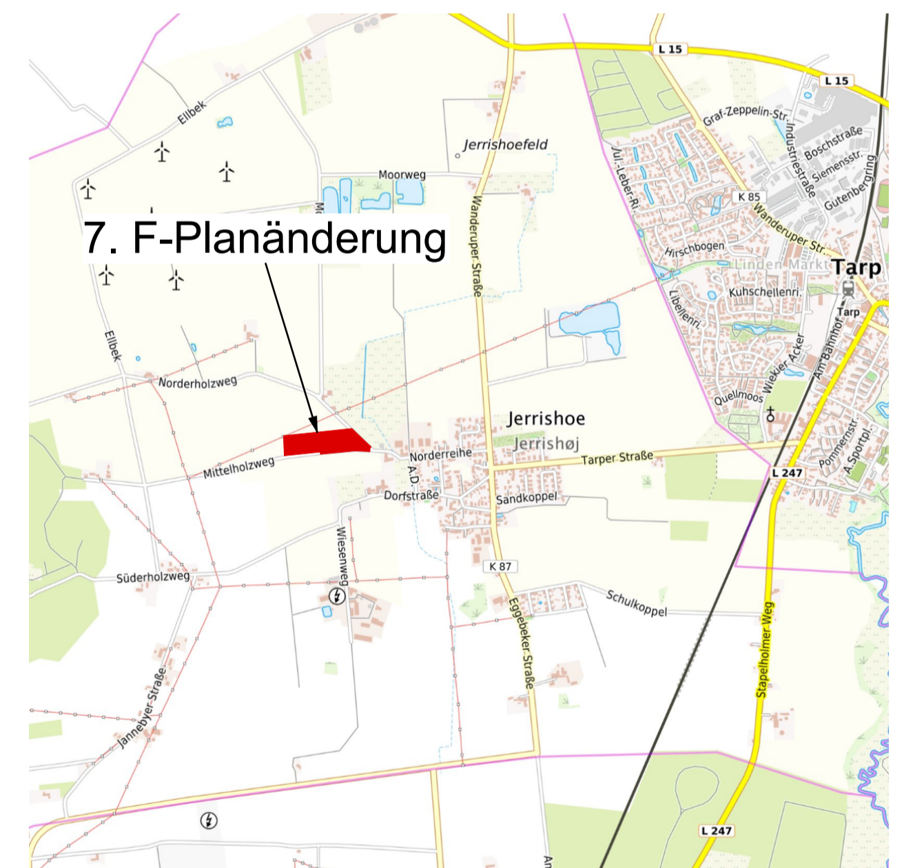
Übersichtsplan Maßstab 1: 25.000